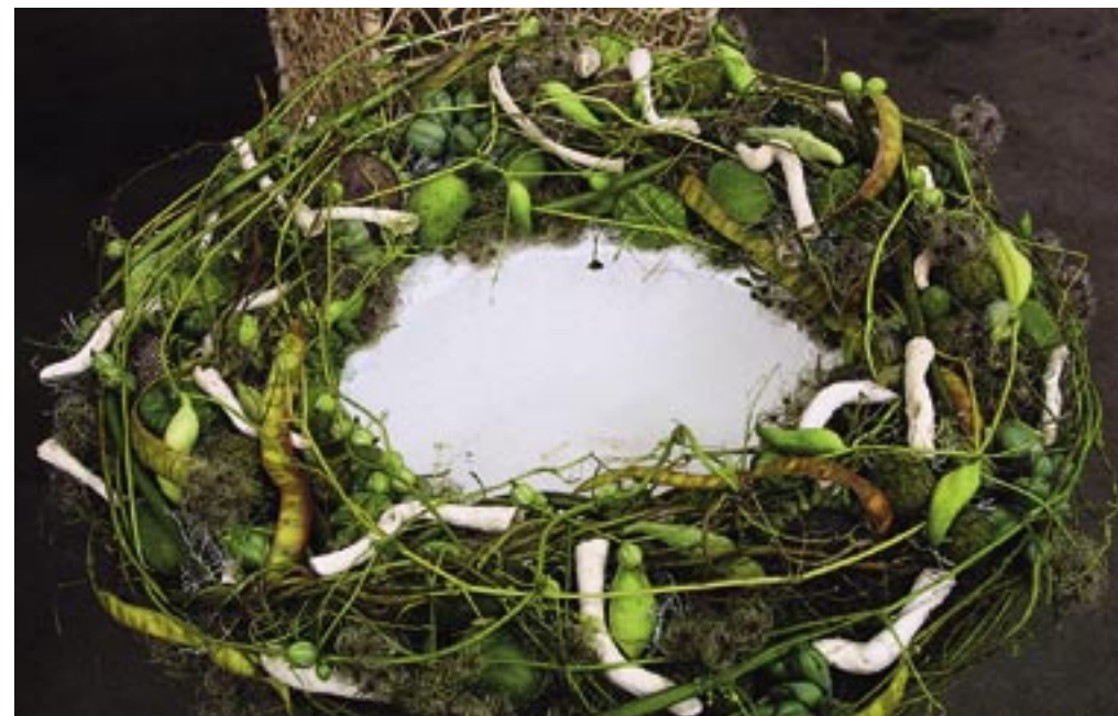
Een krans met natuurlijke materialen maakt Ellen Heurneman van Bloemenatelier Han Fokkink in Lochem.