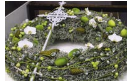
De hier getoonde kransen zijn gemaakt door Nederlandse en Duitse bloembinders tijdens een wedstrijd op Fleuregio in Hengelo op dinsdag 28 september. Alle deelnemers kregen kreeg een strokrans (Ø70cm) tot hun beschikking; gebruikte techniek en materialen mochten zij zelf bepalen.