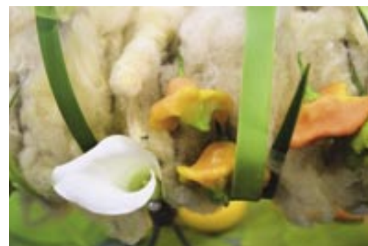
Ook de krans van Sjaeco Gerritsen van Fleur Inn Bloemsierkunst in Epe 'hangt' boven de grond. Hij verwerkt er onder andere geplastificeerde kaarten met afbeeldingen van heiligen in.