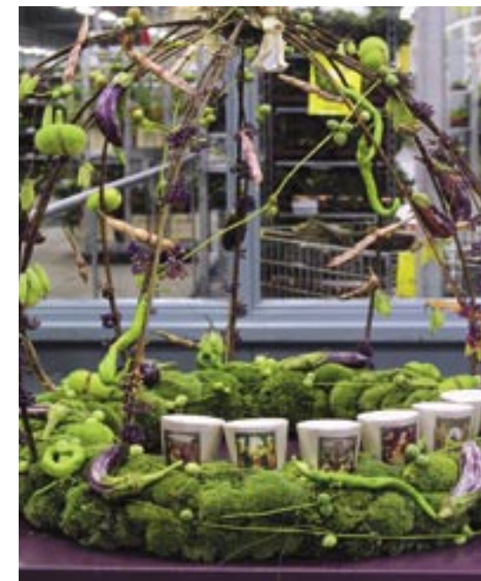
Jacqueline Wargers van Bloembinderij Polman in Ootmarsum werkt eveneens vanuit de krans naar omhoog. In de krans verwerkt zij ook waxinelichtjes met religieuze afbeeldingen.